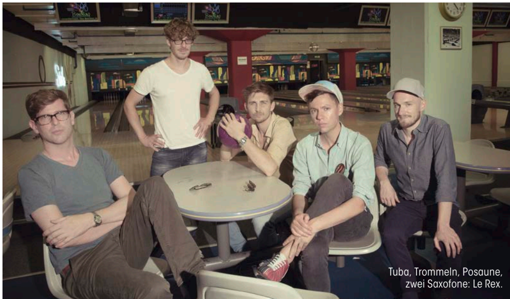
Tuba, Trommeln, Posaune, zwei Saxofone: Le Rex.